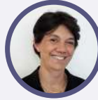
N. CH-BUFFET PROFESSEUR